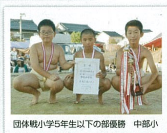
団体戦小学5年生以下の部優勝 中部小