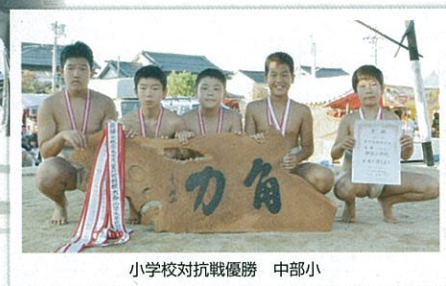
小学校対抗戦優勝 中部小