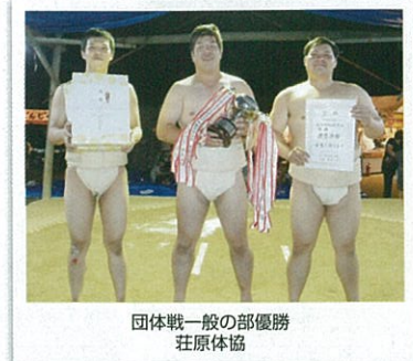
団体戦一般の部優勝 莊原体協