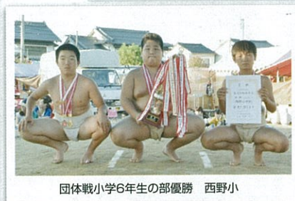
団体戦小学6年生の部優勝 西野小