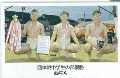
団体戦中学生の部優勝 西中A